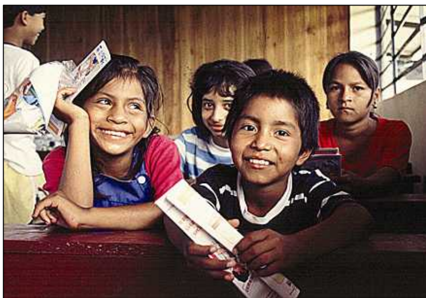
エクアドルの子どもたち

財団法人 日本フォスター・プラン協会(プラン・ジャパン) 〒154-8545 東京都世田谷区三軒茶屋2-11-22 サンタワーズセンタービル11F www.plan-japan.org