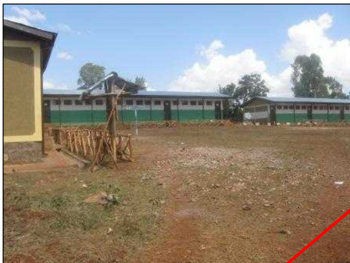
新しくできた校舎全景