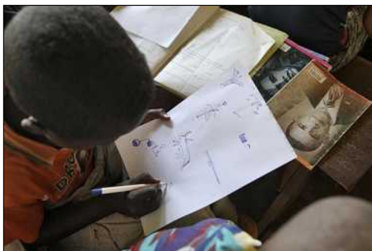
エチオピアの子ども

財団法人 日本フォスター・プラン協会(プラン・ジャパン) 〒154-8545 東京都世田谷区三軒茶屋2-11-22 サンタワーズセンタービル11F www.plan-japan.org