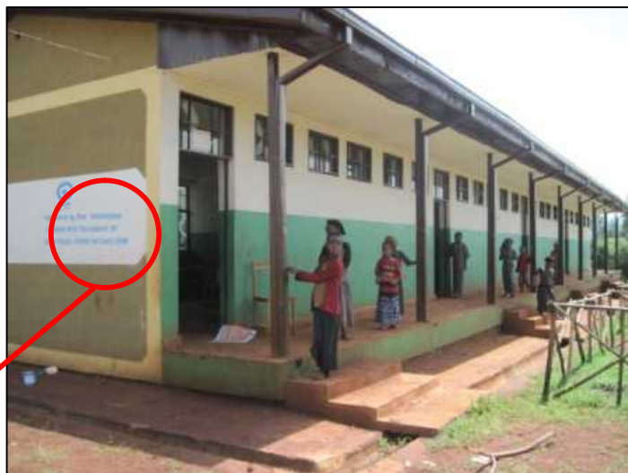
記念プレートがついた教室棟