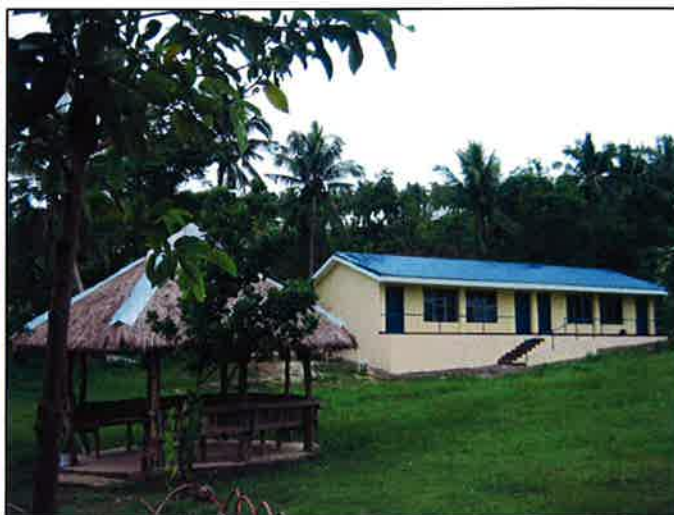
(左)完成した2教室からなる新校舎全景 (右)新校舎はやしの木に囲まれた広々した敷地の中に建っています。