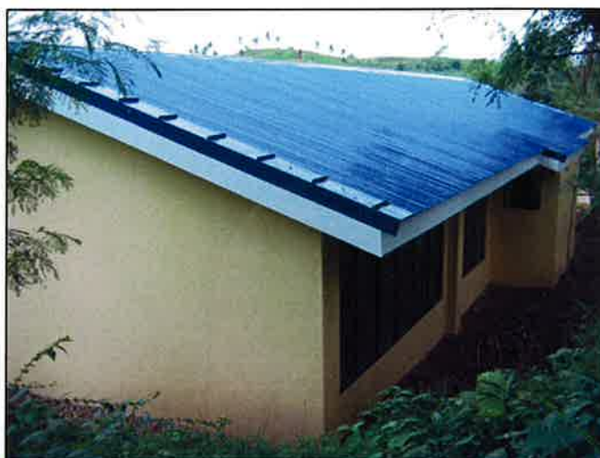
(左)校舎を側面から見たところ。安全性を考慮して、通路には鉄製の手すりを設置しました。 (右)校舎の背面にも大きな窓がついているため、通気性が高く室内で快適に過ごせます。